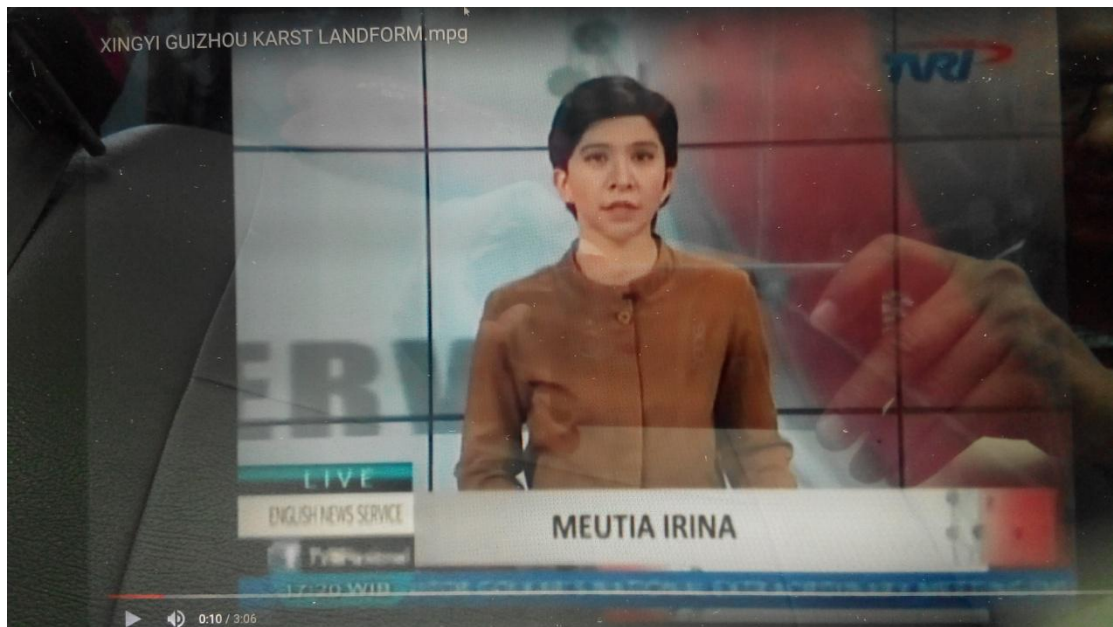
印尼共和国电视台（TVRI）播出截图

说起贵州兴义，很多海外游客就会想到那里是喀斯特王国，惊叹于这片神秘多姿，风情万种的山水。漂洋过海把这个喀斯特王国展现在海外游客面前的最大功臣，就是制作播出这条《Karst landforms of Guizhou》视频的平台——蓝海云。